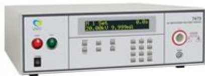
7470 系列 20KV 耐压测试器