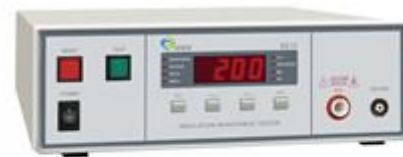
8200 系列 绝缘阻抗测试器 Max.200G